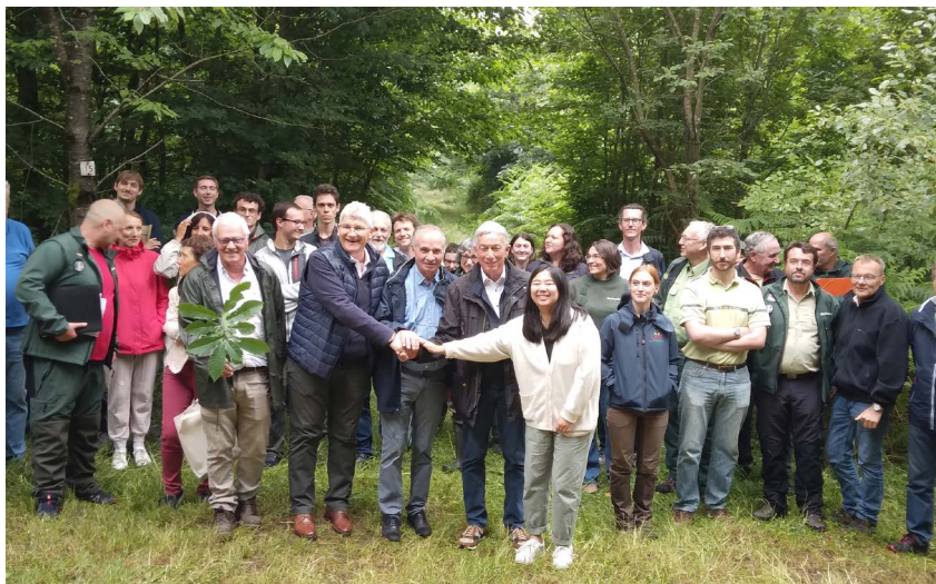
Une expérimentation d'enclos pour protéger les jeunes pousses de « la dent du gibier ».